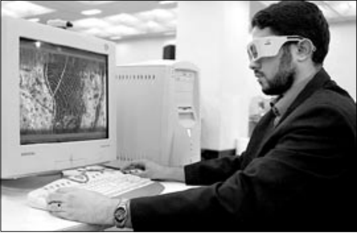
عینک مخصوص دیدن پایگاه‌های اینترنتی غیر اخلاقی در شهر قم توزیع شد!

برآمدگی در ناحیه شکم ندارد و مثل کویر لوت تخت و مسطح و صافه. وقتی که حرف می‌زنه صداش به نرمی و لطافت قصه‌های صبحگاهی رادیو تهران قدیمه. دستانش گرمی آب‌گرم‌های رضاییه را دارد. بوی عطر بدنش بوی افاقیه‌های خیابان‌های شیراز را دارد.