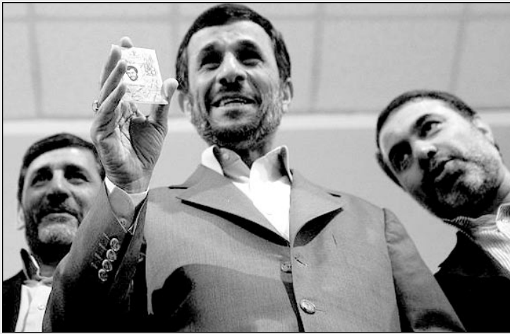
— بالاخره کارت بنزین من از طریق پست به دستم رسید!