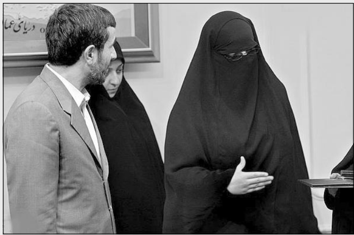
حاج محمود: مطمئن می‌خواهی به نمایندگی از جمهوری اسلامی در رقابت‌های ملکه زیبایی جهان شرکت کنی؟

و چون وزیر کشور کشته نشده قاطی ۷۲ باکره یک آکله جا می‌زنند تا مجاهدین در آینده در هدف‌گیری خودشان دقیق‌تر باشند؟ کسی نمی‌داند، فقط خدا می‌داند.