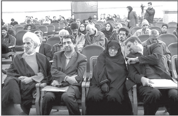
— مادر می‌شه به چادرت دست بزدم؟! —