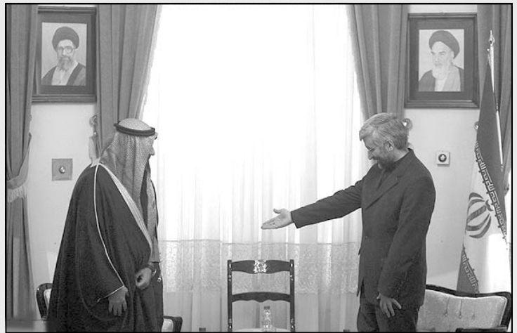
– ببخشید، ولی زیبای عبا می باشد!

توسط مرغان آزاد مزه‌های می‌خورند (و نه قفسی معمول مرغداری‌های بزرگ که در غرب به آن Cage-Free می‌گویند) مرغ را به جای نگاه داشتن در قفس در اتاق مهمانخانه مشتری قرار می‌دهیم تا تمام شب راه برود و در انتظار نورسیده‌هایش قدم برند.