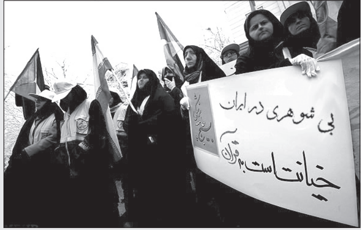
آغاز نهضتی تازه در ایران!