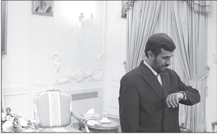
- بالاخره نفهمیدم اول سال ساعت‌ها را جلو می‌برند یا عقب؟

فقط چند تای آن‌ها جان خودشان را تا سر سال تحویل حفظ می‌کنند. امسال هم همین‌طور شد با این فرق که فقط یکی از آن‌ها زنده ماند و بقیه روحشان به بهشت موجودات اقیانوسی و دریایی رفت.