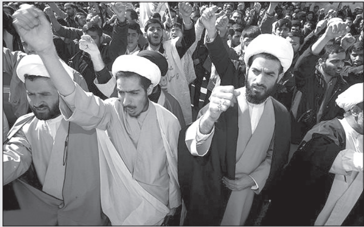
– دیدن رقص شکیرا حق مسلم ماست!

با دوست‌پسرشان سر به بیابان بزنند و بدون مزاحمت پلیس حال بکنند!