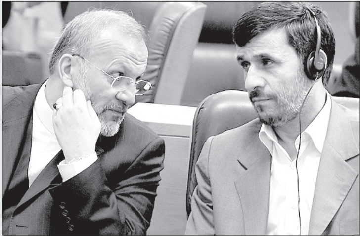
متکی: منمهم اولین بار که به موسیقی راک گوش کردم قیافه‌ام مثل شما شد!

به غیر از استفاده از تیشرت اسلامی خود از مواد محرک و نیروزا (علاوه بر وایاگرا) استفاده می‌نموده است. مربی او ایوانف بلغاری چندی قبل از سمت مربی‌گری تیم وزنه‌برداری ایران اخراج گردید چون مشخص شد که او با کمک زنش (که شیمی‌دان و داروساز معروفی است) تیم وزنه‌برداری ایران و همچنین حسین رضازاده را چیزخور کرده است (به معنای مثبت آن). می‌گویند زن ایوانف داروهایی ساخته بود که کلیه آزمایش‌های دوپینگ را خنثی می‌کرده و به جای نشان دادن مواد نیروزا ورزشکار مرد را مثلاً حامله به مسئولین جلوه داده و آن‌ها را گیج می‌کرده است.