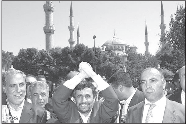
احمدی نژاد: می‌خواهید ببینید با کف دست‌ها چه صدایی می‌تونم در بیارم!

مهاجرت کرده بوده نوشته... بعضی‌ها می‌گویند این را یک دکتر جراح قلب کمونیست نوشته... بعضی دیگر می‌گویند این را یک دکتر جراح مغز کاپیتالیست و پولدار نوشته... من فکر می‌کنم هر که این را نوشته سوسیالیست نبوده... سوسیالیست‌ها تا از دولت پول نگیرند چیزی نمی‌نویسند!