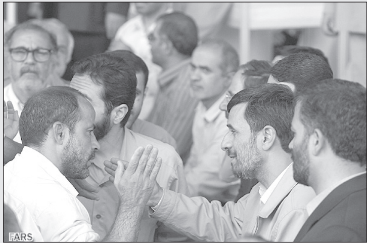
احمدی نژاد: به «های فایو» بده تا عکاسها به عکس با حال بگیرن!

را یاد گرفت؟ سرش را بالا گرفت و گفت: از این نوارهای آموزشی زبان گیر آوردم! فهمید که از جوکش زیاد خوشم نیامد چون بدون لبخند در برابرش ایستاده بودم و نمی‌خندیدم. گفت: اجداد من از مارهای زمان آدم و حوا بودند. ادبیات و زبان در خانواده ما موروثی است. یک پسر خاله دارم که شاهنامه و داستان‌های شکسپیر را حفظ کرده و بدون تپق زدن همه را برایت می‌خواند. باز هم نخندیدم. پرسیدم: چرا شما مارها اهل خشونت هستید؟ من که به تو کاری نداشتم. گفت: دستت را یکباره آوردی وسط بوته‌ها و من ترسیدم و عکس‌العمل نشان دادم. ما مارها به محض احساس خطر حمله می‌کنیم. حتی اگر خطر واقعی نباشد. پرسیدم: فکر کردی می‌خواهم تمشک‌های تو را بدزدم؟ خندید و گفت: من اصلاً تمشک را دوست ندارم اینجا خوابیده بودم، تا تو آمدی و چرتم را پاره کردی. می‌خواهی زنگ بزنم یک آمبولانس بفرستند؟ گفتم: لازم نکرده خودم زنگ می‌زنم. گفت: زهر من زیاد قوی نیست و خطر مرگ ندارد ولی ممکن است دل و