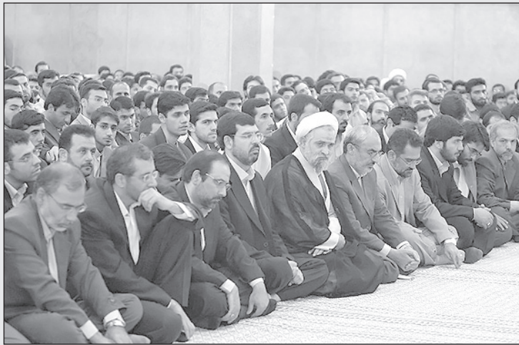
آخوند دمغ: کاش پول نفت رو می‌دادن چند تا صندلی برای ما می‌خریدن!

کمتر از سابق پول به دستشان خواهد رسید. دلم خیلی خنک شده است! * یک سؤال: آیا جشن‌های دو «هزار» و پانصد ساله بیشتر به پیشرفت ایران لطمه زد یا دلار «هزار» تومانی؟