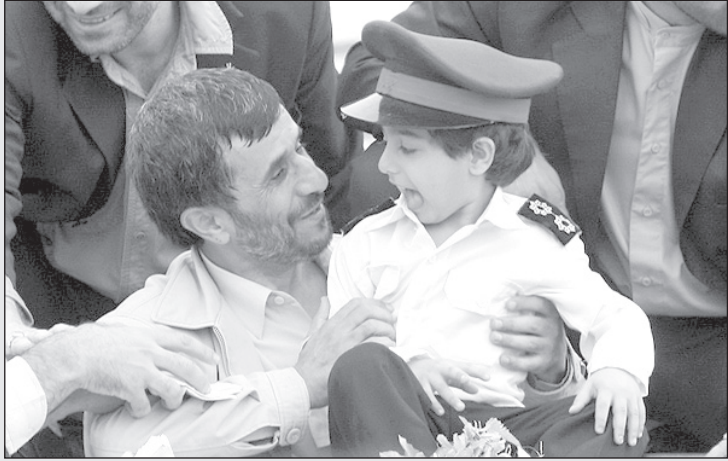
احمدی نژاد: بچه جان وقتی بزرگ شدی می خواهی چه کاره بشی؟ بچه: می خوام افسر نیروی انتظامی بشم مردم رو تو خیابون ها کتک بزنم!