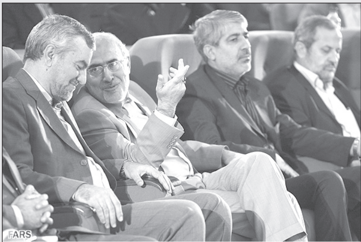
کردان: بابا مدرک گرفتیش کاری نداره، نگهداریش مشکله!

حرف و داستان جدیدی نیست ولی این که مقام و کارمند نیروی امنیت کشور نتواند جاسوسی زنی را بکند که بفهمد با چه کسی «رفت و آمد» دارد، داستان تازه‌ای است!