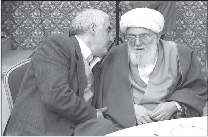
– آره حاج آقا، چطور به شما نگفتن، شاه الان سی ساله که رفته!