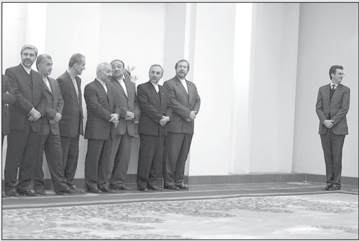
– آقای احمدی نژاد کجاست؟ – کاپشن ایشان از خشک شویی به موقع نرسیده، کمی تاخیر دارن!

سه هفته پیش به فضا پرتاب شد، وصل شده و صاحب‌های با سرنشینان آن انجام دهیم. متن این مصاحبه در هیچ رسانه‌ای نیامده است. صدای زنگ تلفن – رینگ... رینگ... صدای خش و خش و پارازیت – الو. سلام – شما؟ – من از کره زمین زنگ می‌زنم. می‌خواستم با شما مصاحبه کنم درباره سفینه امید. – از اطلاعات اجازه دارید؟ – بله. صد درصد. حاج آقا... فرمودند اشکالی نداره. – شما از کجا فهمیدید این سفینه سرنشین دارد؟ همه جا اعلام کردند بدون سرنشین است. – آن را گفته‌اند که به کسی نگوییم. حاج آقا... فرمودند. – خوب بفرمایید. – راستی چرا اینقدر کیفیت صدای تلفن شما بده؟ – از شرکت مخابرات بی‌رس. روزی ۲۰ بار باید زنگ بزنییم به مرکز و فقط دو بار وصل می‌شویم. اصلاً بیشتر وقت‌ها اینجا به جای اکتشافات صرف شماره گرفتن شده. – از اون بالاها تعریف کنید. – اینجا اولین چیزی که جلب توجه می‌کند هوای پاک و تمیز است. اگر کسی توی تهران دودآلود زندگی کند این را زود متوجه می‌شود. اصلاً زنگ و رویمان باز شده و بهتر نفس می‌کشیم. – اونجا چه احساسی دارید؟ – فکر می‌کنیم که به خدا نزدیکتر شده‌ایم. – از کجا می‌دانید خدا آن طرف کهکشان است و در قسمت پایین نیست؟ – به هر حال اینجوری احساس می‌کنیم. شما می‌دانستید که باید به کجای فضا بروید؟ یا همینجوری شما را پرتاب کردند؟