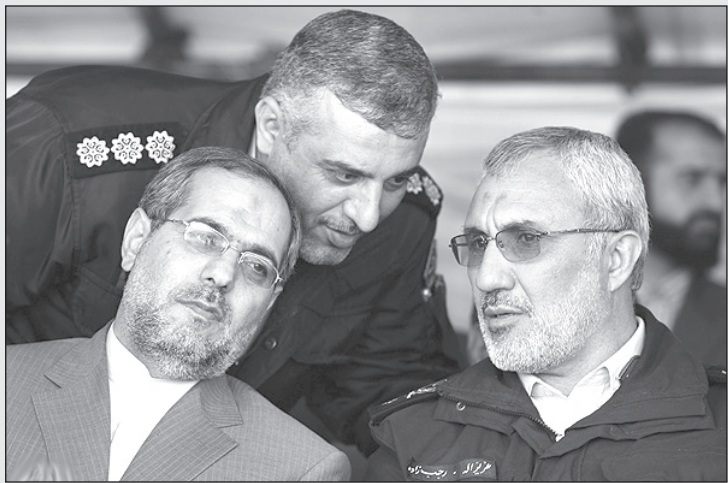
– قربان «دی وی دی» یه شوی تازه از شکیرا رسیده؛ بعد از مراسم تشریف بیارین خونه ما!

می‌کردم ولی در عوض تعداد آن‌ها را در دنیا بیشتر می‌کردم.