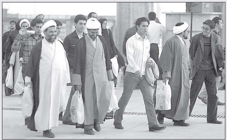
شرکت کنندگان در نطق انتخاباتی احمدی نژاد با دست پر به خانه برگشتند!

شرکت فایر فاکس با قرار دادن اخطار در صفحه قرمز رنگی با حروف درشت «Attack Site Reportad» به مشتریان خود اعلام کرده که این پایگاه می‌تواند مخفیانه با قرار دادن انواع ویروس و نرم‌افزارهای مخفی جاسوسی (لباس شخصی دیجیتال) به اطلاعات و مدارک خصوصی مراجعه کننده به این سایت دسترسی پیدا نموده و حتی آن‌ها را کپی کرده و بدزدد. البته می‌توان اخطار این شرکت را نادیده گرفت و به این پایگاه اینترنتی وارد شد. توصیه من به دوستانی که ریسک وصل شدن به پایگاه این روزنامه را جدی نمی‌گیرند این است که حداقل قبل از ورود به این سایت عکس‌ها و ویدیوهای آنچنانی خود را از کامپیوتر حذف نمایند تا آن‌ها به دست کارکنان نامحرم این پایگاه اینترنتی روزنامه «کیهان» چالپ تهران نیفتد!