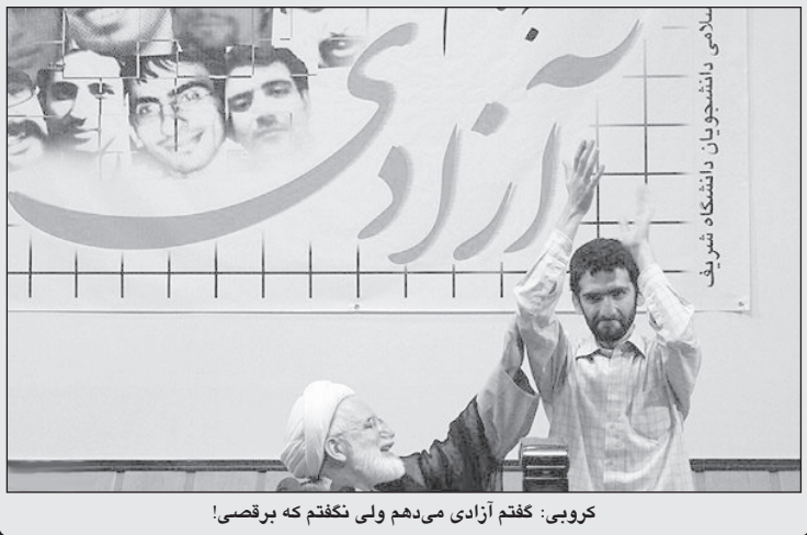
کروبی: گفتم آزادی می‌دهم ولی نکفتم که برقصی!

عملکرد آقای احمدی‌نژاد. اول کار شما گفتید که از سوی امام زمان نوری در سازمان ملل شما را احاطه کرد. این به من خیلی برخورد. می‌دانید که من مذهبی هستم.