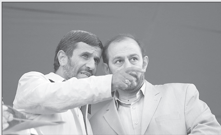
احمدی نژاد: اون یارو ردیف آخر که پیراهن سبز پوشیده رو فوراً سرکوبش کنید!

زندان‌های مختلف به‌ویژه کهریزک و اوین صورت گرفته و مسئولین این زندان‌ها را متهم به آزار و تجاوزات جنسی کرده‌اند از کلیه کسانی که در چند هفته بعد از اختتام انتخابات ریاست جمهوری در این اماکن بسر می‌برده‌اند تقاضا می‌شود که برای امور رسیدگی به پرونده خود در دادگاه شعبه چهاردهم تهران حضور به هم رسانند تا ترتیب بررسی شکایت آنان داده شود.