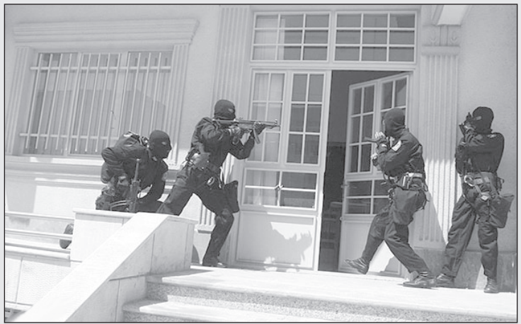
ماهوره را بگذار روی سرت و بیا بیرون تسلیم شو!

سیخ شدند. چند دقیقه به همان حالت ماندند و به دست بریده‌ای که روی زمین افتاده بود خیره شدم. به دور و برم نگاه کردم. هیچکس نبود. جلوتر رفتم و به دست بریده نگاه کردم.