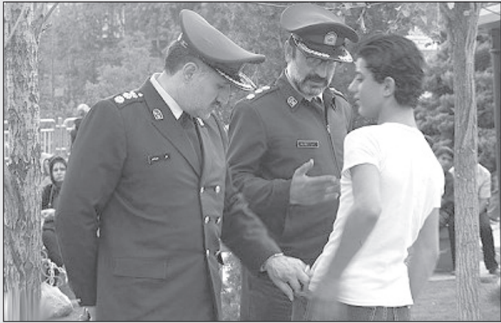
اگر شوهرت سبز پات باشه می‌بریمت کهریزک برای تفهیم اتهام!

می‌گویند کمبود آب آشامیدنی در عرض یکی دو دهه آینده آن قدر بد خواهد بود که حتی مریض‌ها در بیمارستان کمبود سرم خواهند داشت. خیلی زیاد نگران هستیم.