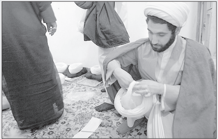
طلبه: بابا این که از کره زدن کراوات هم سخت‌تره!

ما طوطی نداریم. - فردا دوتا از برادران می‌آیند تا این طوطی را برای بازجویی به دفتر ما بیاورند. - برای چی؟ شوخی می‌کنید؟ - که ارزش بپرسیم از کجا خط می‌گیره و این حرف‌ها را از چه کسی یاد گرفته؟ - آخه طوطی را که نمی‌شود به بازجویی کشاند. - چرا نمی‌شود؟ ما آدم بزرگ را بازجویی کرده‌ایم طوطی که سهل است. - اگر اعتراف نکرد چی؟ شما مثل این که دارید با من شوخی می‌کنید. - نه خانم. اعتراف می‌کند. بعد از این که به شما برگرداندیمش مثل قناری و بلبل براتون آواز می‌خونه و از گفتن «الله و اکبر» و «مرگ بر دیکتاتور» اظهار پشیمانی خواهد کرد. - موفق باشید. ولی گفتم که ما طوطی نداریم. - فکر می‌کنید شماره را عوضی گرفته‌ام و یا برادران اطلاعاتی ترکمون زده‌اند؟ - نمی‌دانم. به هر حال ما طوطی نداریم. - به هر حال خیلی ممنون از وقت شما.