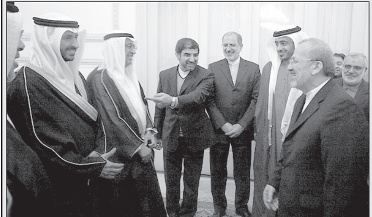
– جناب متکی، این طرف جوک‌های عربی باحالی بلده. براتون ترجمه کنم؟

در حال سرکوب ناآرامی‌های خیابانی و احتمالاً کتک زدن شخص یا اشخاصی در اختیار دارند تقاضا می‌شود با آرایه آن‌ها به همسر بنده که مرا متهم به رابطه با خانم دیگری در این روز کرده خانواده‌ای را از نگرانی بیرون بیاورند. به مدارک آرایه شده با کیفیت خوب صدا و تصویر مژدگانی قابل توجهی تعلق خواهد گرفت. لطفاً با شماره موبایل ۶۶۶۶ – ۶۶۶ – ۹۱۰ تماس حاصل نمایید.