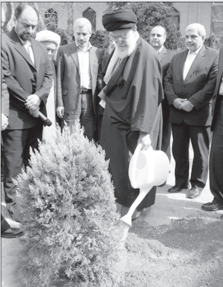
آیت‌الله خامنه‌ای: امیدوارم این درخت «سبز» نشود!

زنان را مثل حیوانات از هم جدا نکرده بود به هتل رفتن. توی اتاق هتل محل اقامتم که توی بزرگراه جردن بود با ریموت تلویزیون سیصد کانال ایرانی را که از تهران و شهرستان‌ها پخش می‌شدند و دویست کانال ماهواره‌ای خارج از کشور را تماشا کردم و لبخند زنان خوابیدم.