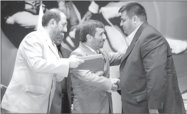
احمدی‌نژاد: ماشالله دویپنگ‌ها خوب بهت ساخته، حسابی چاق شده‌ای!