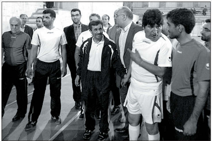
مورالس (رئیس جمهور بولیوی) به مترجم: از محمود بپرس کسی توی ایران شورت نمی‌پوشد؟

جنگ‌ها بوی بد ناشی از خوردن پیاز بوده که دشمن را فراری می‌داده است اما ثابت شده که برای کشتن این همه سرباز دشمن نیاز به کالری زیادی بوده که نان و پیاز خالی نمی‌توانسته آن را تامین کند.