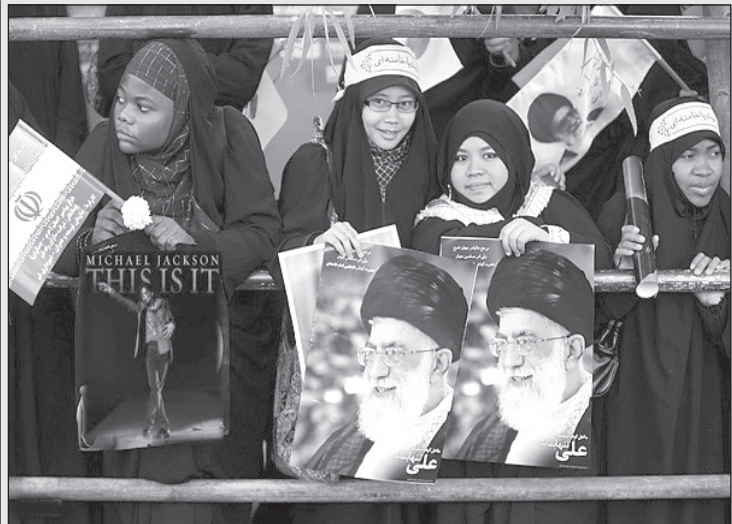
تدابیر جدید امنیتی جهت نزدیک شدن مردم به رهبر طی برگزاری نماز جمعه!

بعد از گذراندن امتحانات کتبی و شفاهی قبول شدم و به مرحله دوم مصاحبه رسیدم.