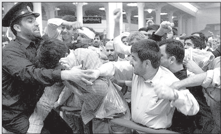
چه کسی می‌گوید «جنبش سبز» مرده است؟!

دارا را می‌باشد. مجسم کنید که سرما خورده‌اید و دکترتان می‌گوید: برات سه تا بوقلمون نوشتم یکی را صبح بخور، یکی را ظهر و یکی را قبل از خواب!