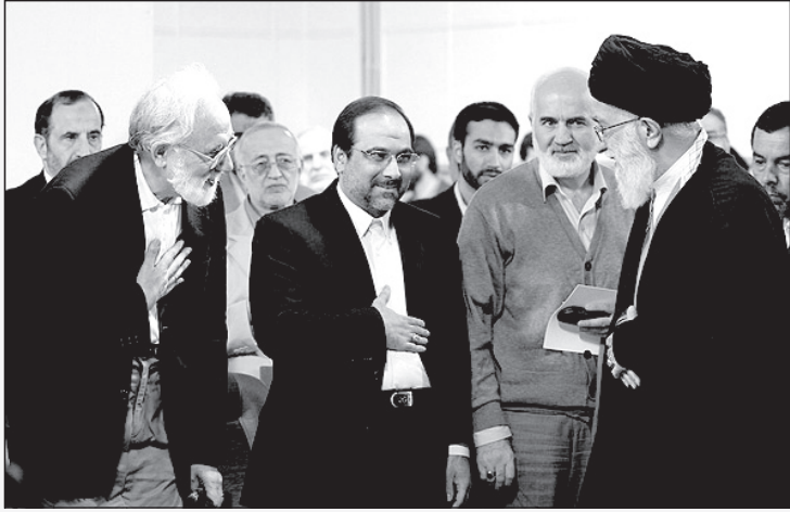
خامنه‌ای: وقتی دست را بجای قلبت روی شکمت می‌گذاری معلومه ولایت فقیه را قبول نداری!

گفتم: نمی‌دانم. گفت کوتاه نیا و ازش بخواه که بیشتر از پارسال بهت پاداش بده. گفتم: چطور مگه؟ گفت: یک جفت کفش دیدم مثل ماه. قیمت‌ها هم که می‌دانی از پارسال تا حالا خیلی بالا رفته!